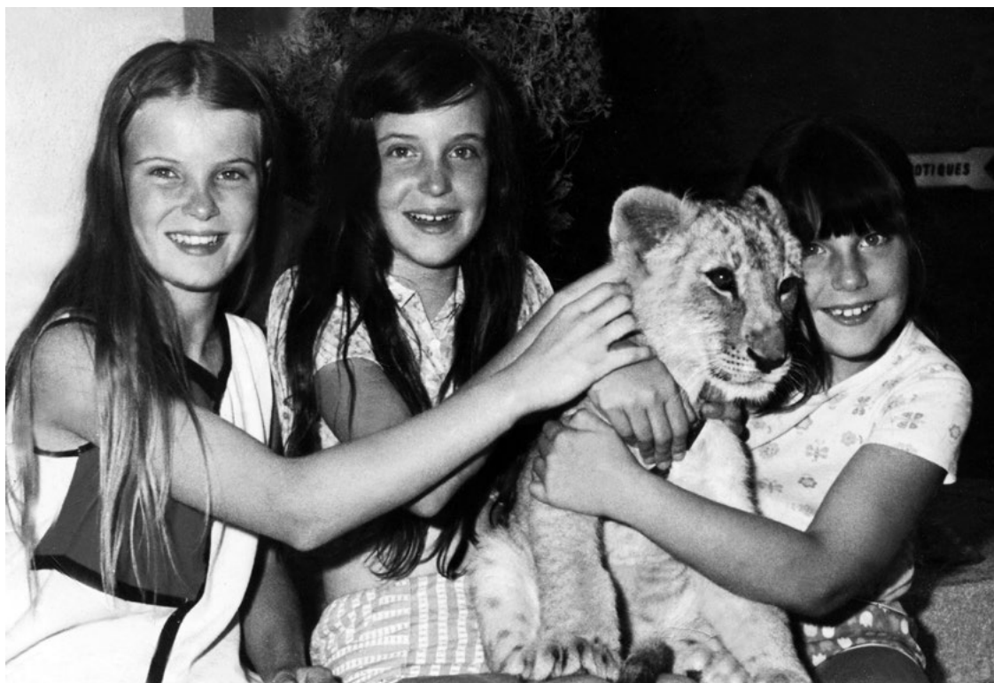
Šelmy patřily k našim létům u táty (spolu s Beatrice a Patricií)