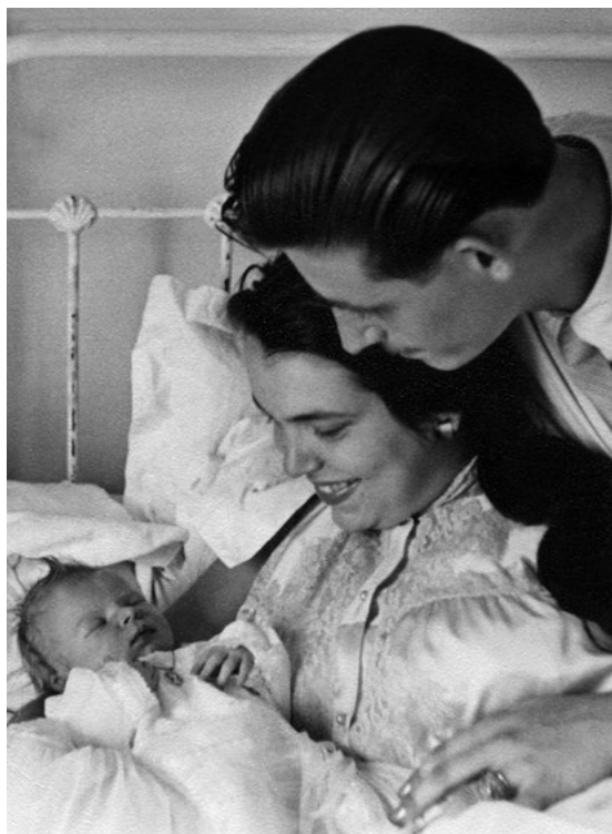
První setkání se světem