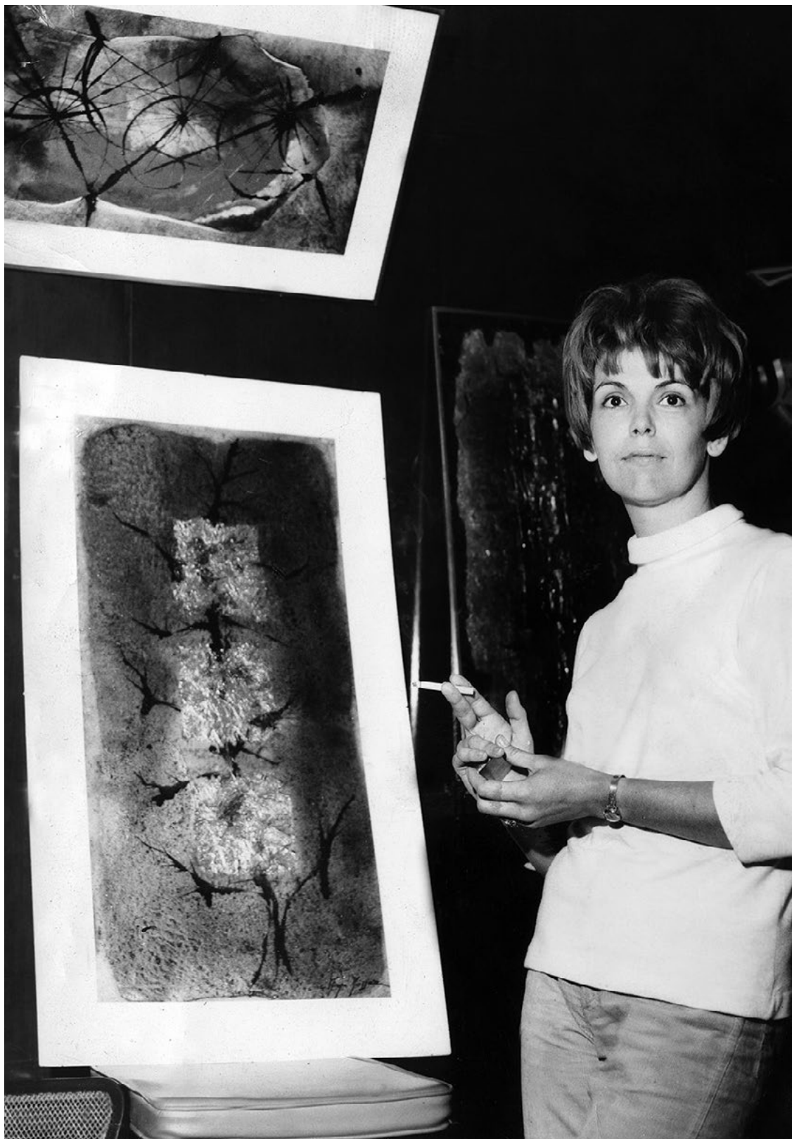
Maminka, sochařka a malířka