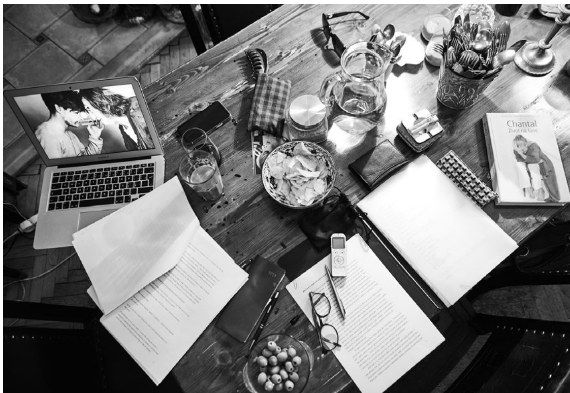
Píšeme „dvojku“ – jako poprvé, u velkého stolu.