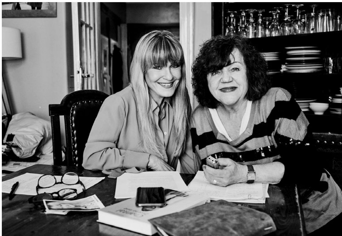
Zase natáčíme...