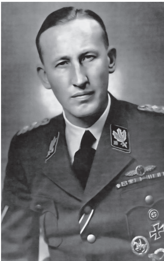
Portrétní snímek osmatřicetiletého Heydricha, 1942.