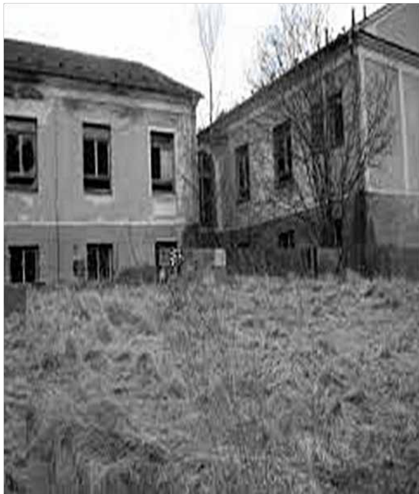
Zbytek provozní roty VÚ 8186. Budova ani útvar v současné době již neexistují.