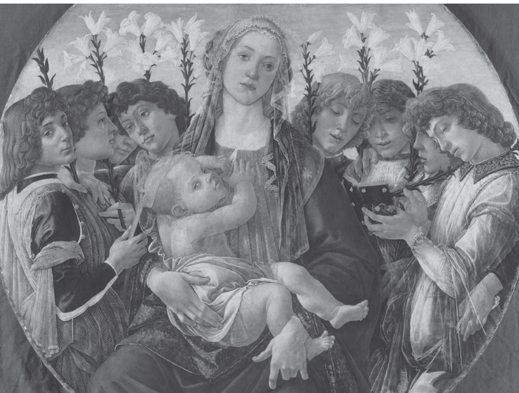
Sandro Botticelli, Madona a osm zpívajících andělů , 1477.