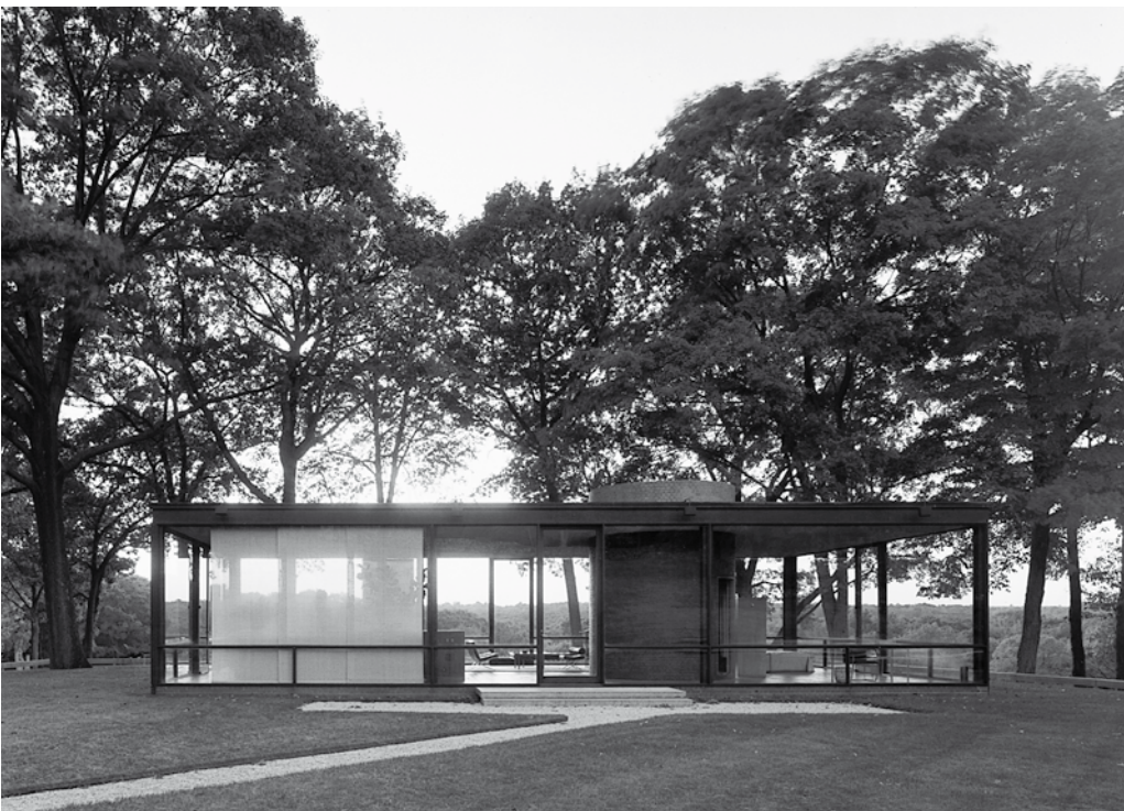
Často bychom měli neustále špatnou náladu. Philip Johnson, Skleněný dům, New Canaan, Connecticut, 1949.