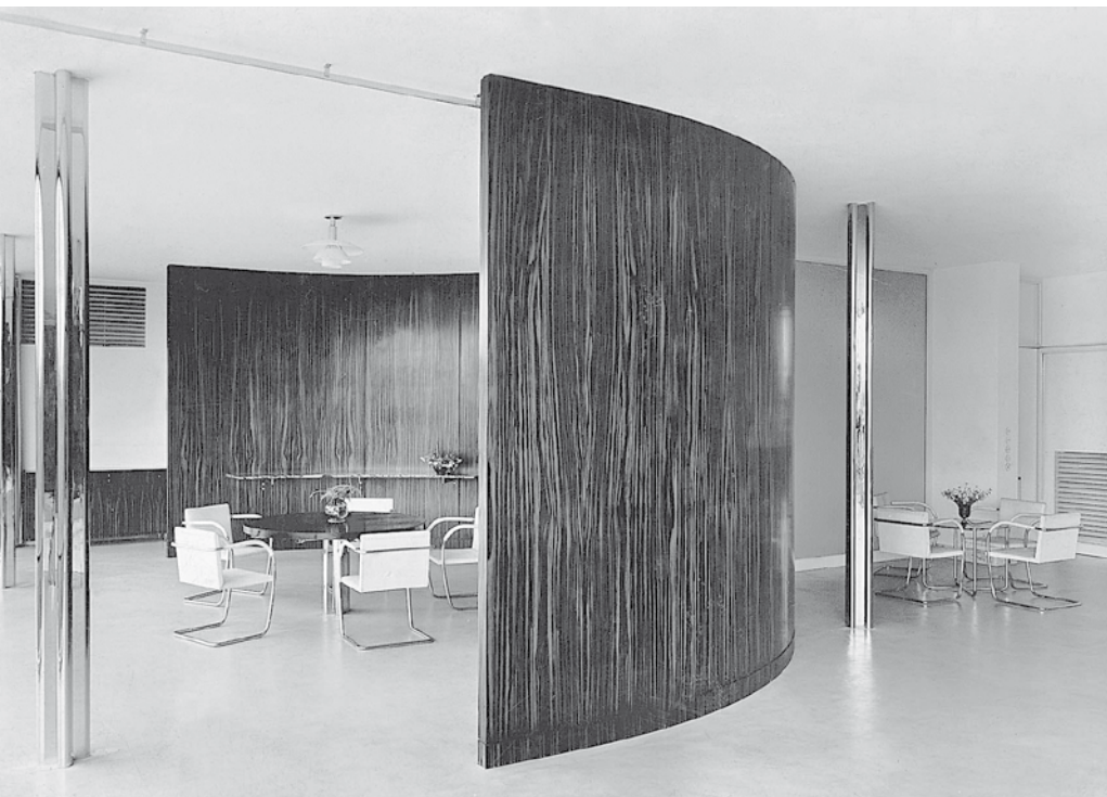
Architektura nám může živě předvést, kým bychom mohli být. Mies van der Rohe, jídelna, vila Tugendhat, Brno, 1930.