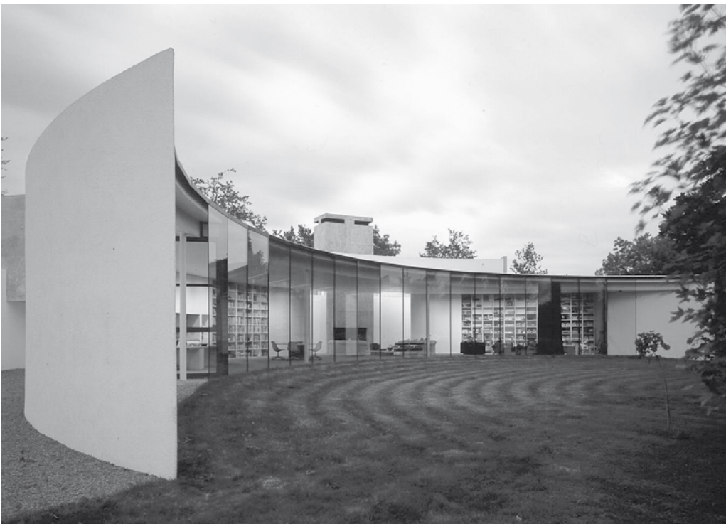
Život většinou nevypadá takhle. Ken Shuttleworth, Pülkruhový dům, Wiltshire, 1997.