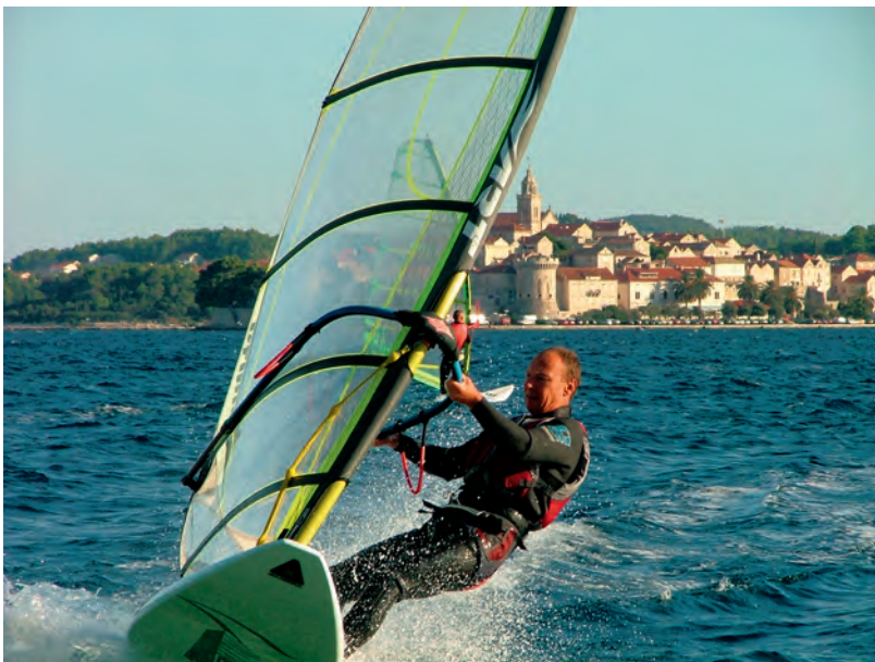
Zážitky z windsurfingu umocňuje hezké prostředí

a částečně silové a silově vytrvalostní. Pohybových dovedností a etází úrovně jejich provedení je velké množství a to od velmi úzkého základu až k téměř neohraňčenému vrcholu. Vědomosti se rekrutují jednak z oblasti materiálové, technické, taktické a částečně i z oblasti meteorologie. Tímto širokým spektrem podmiňujících faktorů výkonnosti a spolu s prvkem relativní bezpečnosti a šetrnosti k pohybovému aparátu se řadí ke sportům, který lze provozovat dlouhá léta, bez úbytku motivace a kde se do určité úrovně velmi stírají věkové handicapy.