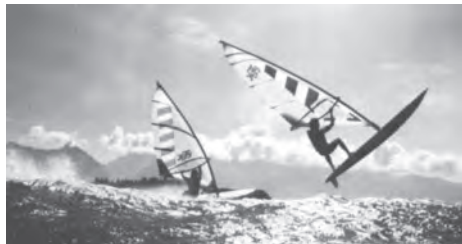
Již Allroundy z počátku 80. let umožňovaly jednoduché skoky

V roce 1982 byla na windsurfingu oficiálně překročena hranice 50 km/hod. V roce 1983 byla po-