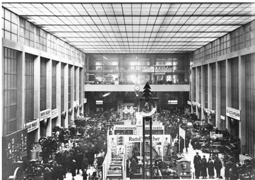
Obrázek 3 Veletržní Palác

V roce 1924 byl účelově postaven pražský Veletržní palác , který se stal ukázkou moderní konstruktivistické architektonické stavby v Evropě. Sloužil k pořádání pražských vzorkových veletrhů, na kterých se vystavovalo převážně spotřební zboží. Tyto výstavy trvaly až do roku 1951, kdy zanikají.