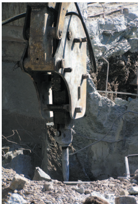
Obrázek 3.2 Bourání pneumatickým kladivem

Provádí se obvykle buldozerem, nebo těžkým vozidlem. V případě použití těžkého vozidla se příslušná konstrukce (krov, zdivo, strop) připojí k vozidlu pomocí lan. Pojezdem vozidla pak dojde ke stržení konstrukce.