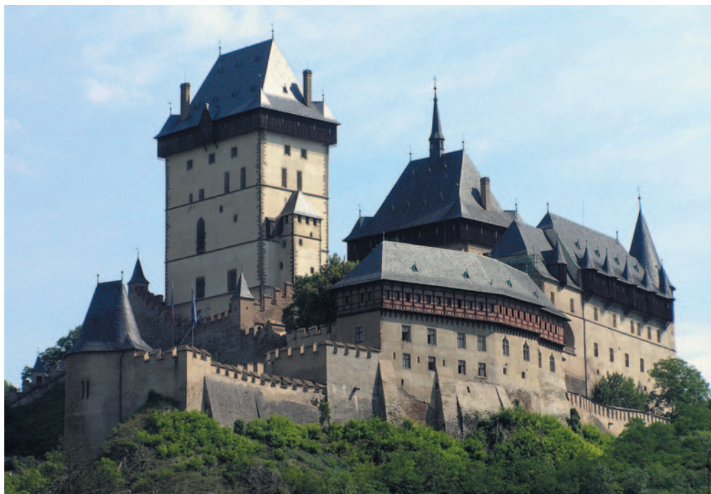
Obrázek 1.3 Hrad Karlštejn – národní kulturní památka