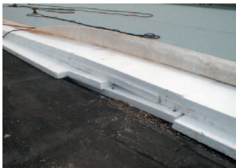
Obrázek 2.4 Závada zapříčiněná dodavatelem – nedbalé uložení tepelné izolace v ploché střeše