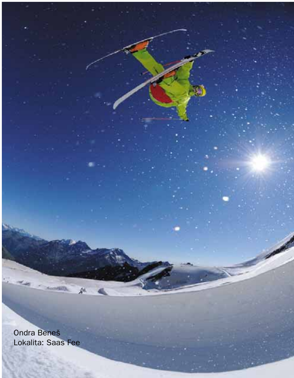
Ondra Beneš Lokalita: Saas Fee

Klasická U-rampa má sklon 20–25 stupňů po spádnicí, její délka se pohybuje mezi 70–100 m a výška okolo 4–4,5 m. V nejkvalitnějších světových snowparcích se můžete setkat s vyššími a delšími U-rampami, kterým se někdy říká „superpipe“ (až 5,5 m vysoké a dlouhé až 150 m). Half pipe se upravuje speciálním zařízením na rolbu (např. pipe dragon) a její stavba a údržba je výrazně náročnější, než je tomu například u big airu.