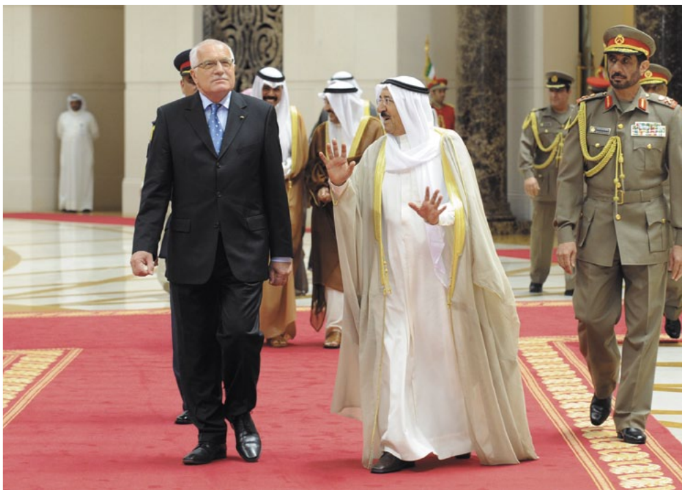
Uvítání českého prezidenta kuvajtským emírem.

D o Kuvajtu na státní návštěvu jedu již podruhé. V roce 1996 jsem tam byl na podobné návštěvě v roli předsedy vlády, v obou případech je to i s delegací českých podnikatelů. Tehdy to bylo pouhých 5 let po devastující irácko-kuvajtské válce, při které byla zničena naprostá většina kuvajtského průmyslu, infrastruktury a budov. Bylo to tehdy vidět na každém kroku. Jsme moc zvědaví, jak to bude vypadat dnes, 20 let po válce. První zpráva je, že letiště je úplně nové.