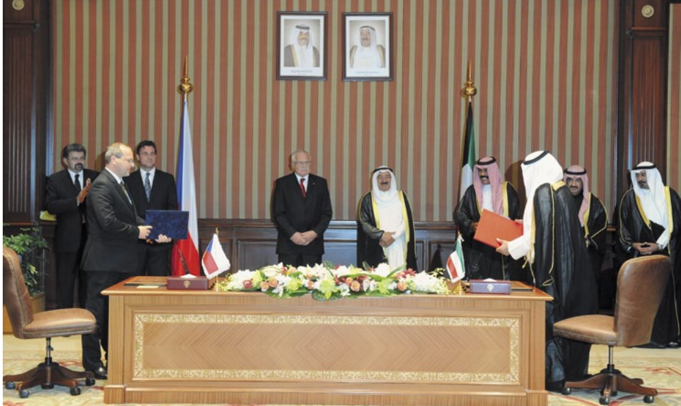
Podpis bilaterálních smluv mezi Českou republikou a Státem Kuvajt.

zásob) byly v Kuvajtu objeveny až ve třicátých letech dvacátého století. Teprve tehdy začalo ono monokulturní zbohatnutí země. Když kdokoli v Kuvajtu říká „před“ a „po“, myslí se tím před ropou a po jejím objevení.