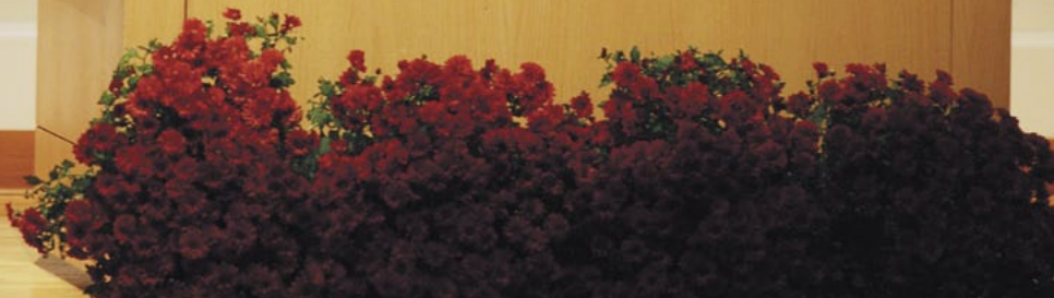
Projev na Cornellské univerzitě.