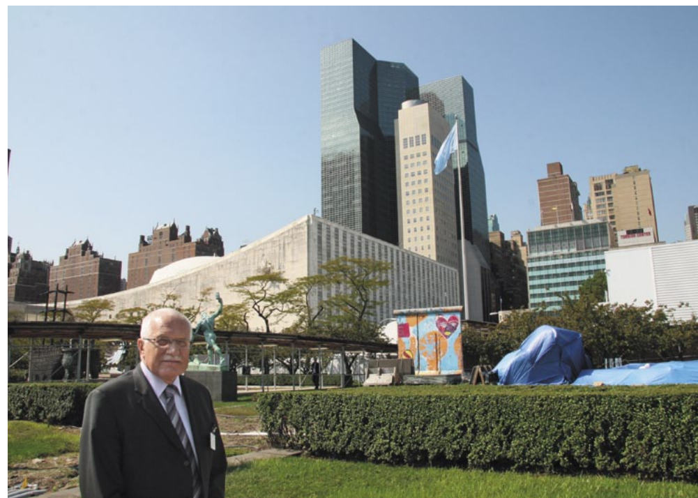
U sídla OSN v New Yorku.

Jednu změnu jsem si ale při ranní snídani v hotelu proti loňsku uvědomil. Hledám stůl, ke kterému bych si chtěl přisednout, a uvědomil jsem si, že jsem loni seděl s prezidentem Kaczyńským a jeho ženou. Moc mi tu oba chybí. Nemáme tolik skutečných přátel.