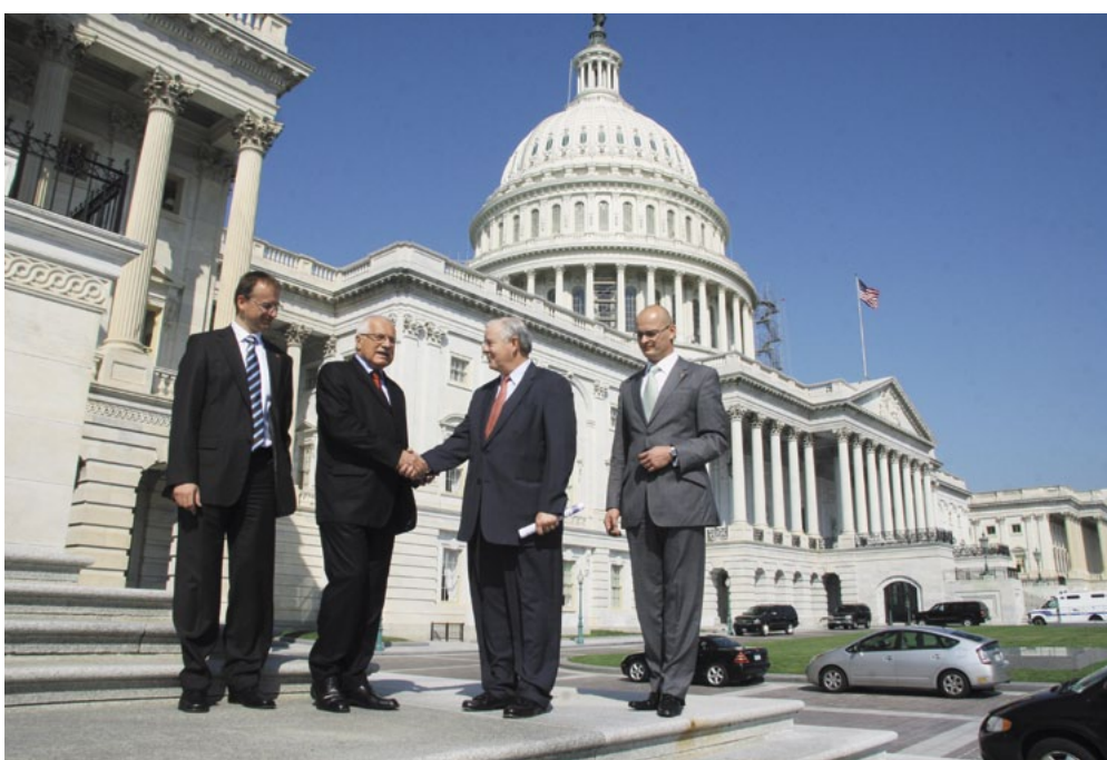
S kongresmanem Joem Bartonem, který vede skupinu přátel ČR ve Sněmovně reprezentantů.