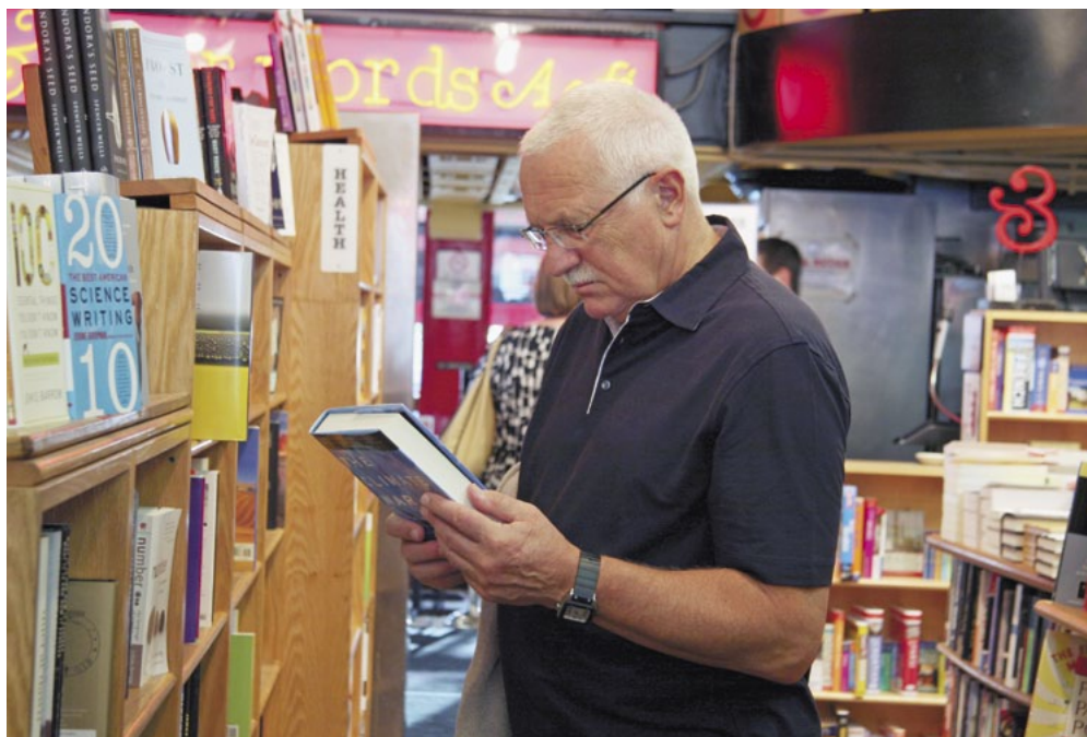
V oblíbeném knihkupectví Kramerbooks ve Washingtonu.

Po krátké regeneraci po dlouhé cestě s mezipřistáním v New Yorku, kde jsme nechali pana ministra Schwarzenberga, jdeme na – pro mne nejmilejší – místo Washingtonu, kde se cítím dobře. Tímto místem je půvabný Dupont Circle. Nejdříve si dáme nezbytnou kávu ve starém známém Starbucksu, pak zajdeme do vedlejšího, skoro bych řekl kultovního knihkupectví Kramerbooks a nakonec jdeme na večeři do spíše evropské než americké restaurace Al Tiramisu.