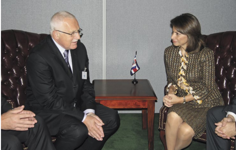
Jednání s prezidentkou Kostariky na půdě OSN.

V rekonstrukci procházející a totálně chaotické – i bez rekonstrukce – budově OSN začíná třídní, tzv. všeobecná rozprava 65. valného shromáždění OSN. První mluví generální tajemník OSN Korejec Pan Ki-mun. Hned v úvodu měl promluvit americký prezident Obama, ale opozdil se. Místo něj mluvila švýcarská prezidentka. V dalších dnech postupně vystoupí všech 192 prezidentů (či premiérů) – v hantýrce OSN „HoD“, neboli heads of delegations – členských zemí.