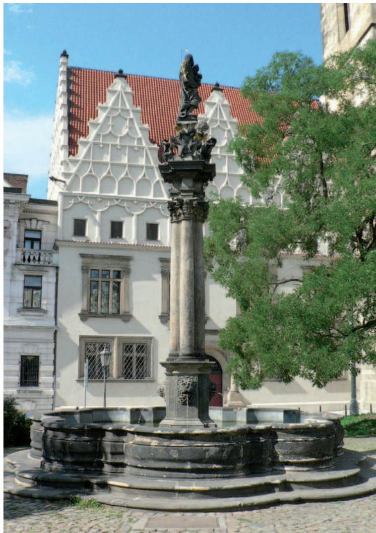
Sloup sv. Josefa před Novoměstskou radnicí v Praze

Tak se průvodním jevem nástupu novověku stal nebývalý nárůst zájmu o řecko-římskou klasiku i o zaniklé kultury Východu. Mezi nimi pochopitelně zaujal stěžejní pozici starý Egypt.